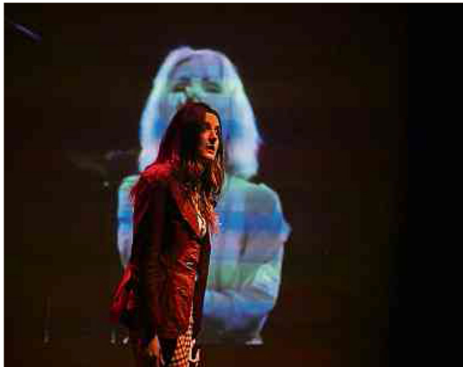
Une mise en scène dans une scénographie «vintage».